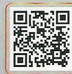
สารคดีสั้น เรื่อง "ผมเป็นราษฎร ที่ไม่มีสิทธิเลือกตั้ง"