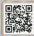
สารคดีสั้น เรื่อง "เวนคืน ไม่ใช่ขบวนการ"