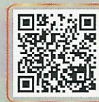
สแกน QR CODE เพื่อรับชมวิดีโอทั้งหมด